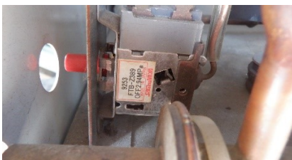
主電源の圧カスイッチ不良